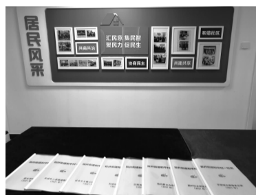
社区向居民展示新时代文明实践站相关工作材料