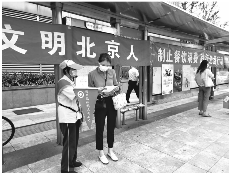
文明引导员向居民发放文明祭扫宣传单

“今后，我们将继续加强新时代文明实践站的功能，面向人民群众开展的理论宣讲、主题教育、文化传承。”社区工作人员说道。后续，双井街道也将持续推进地区新时代文明实践站的建设，引导居民群众弘扬时代新风、传播文明理念，倡导科学文明健康的生活方式，同时实践站还会通过开展志愿者服务活动来打动、引领居民群众，真正实现群众在哪里，文明实践就延伸到哪里。