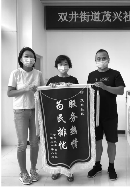
居民给茂兴社区送锦旗