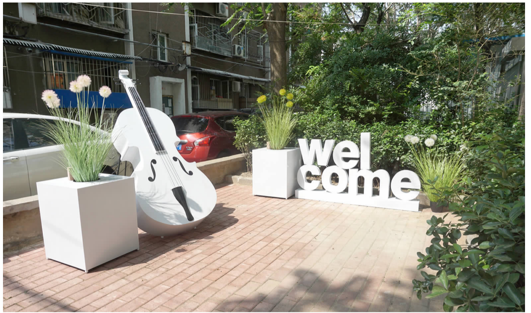
广外南社区新增小微景观

改造后空间相对封闭,没有车辆通行,小区居民有了安全舒适的休闲空间,更多老年人及儿童有了健身场所。后续,社区还将根据小区情况进行升级改造。