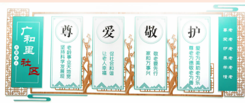
广和里社区活动室张贴文明标语