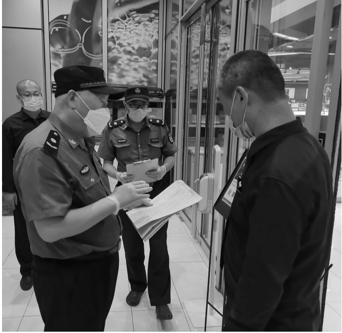
双井综合行政执法队检查商户