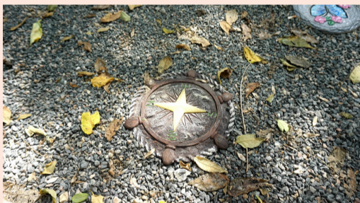
广外南社区改造增添石子景观