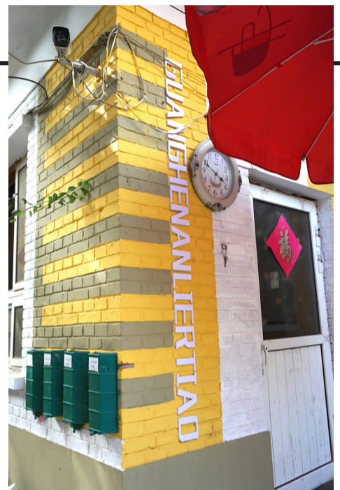
粉刷后的警卫室焕然一新

双井聚焦空间、环境、人文等要素,通过打造全景楼院、全要素小区、建设“井点”,推进小区有机更新,不断优化社区生活环境,为居民提供优美的环境,提升居民的幸福感和获得感、安全感,打造双井“美美与共 井井有条”新格局。 ■文/李竺霖