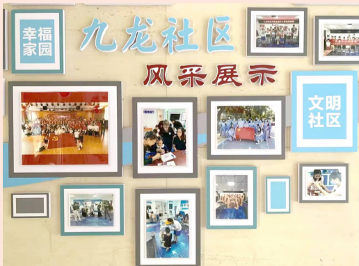
九龙社区新建楼门文化墙