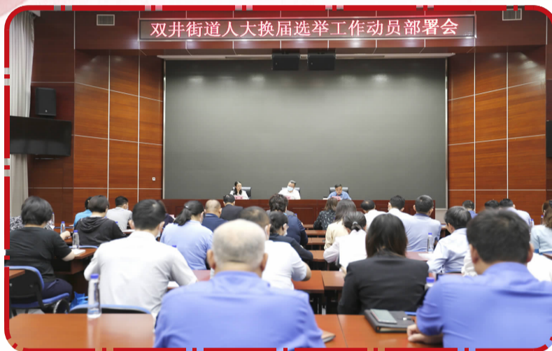
双井街道召开人大换届选举工作动员部署会

做好此次区级人大换届选举工作,任务艰巨、责任重大,双井街道将在区委、区人大的统一领导下,以高度的政治责任感和历史使命感,扎实做好换届选举工作,确保换届选举工作取得圆满成功,奋力书写“美美与共 井井有条”的双井发展新篇章,为朝阳建设“四区”,为北京加快建设国际一流的和谐宜居之都作出新的更大贡献!