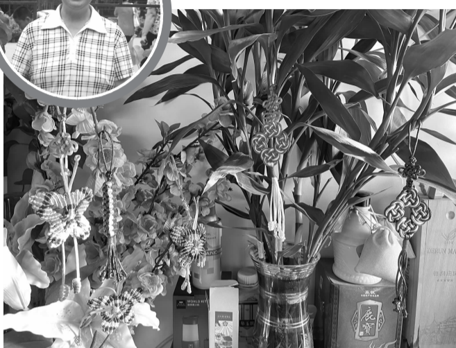
家中悬挂的手工编织作品